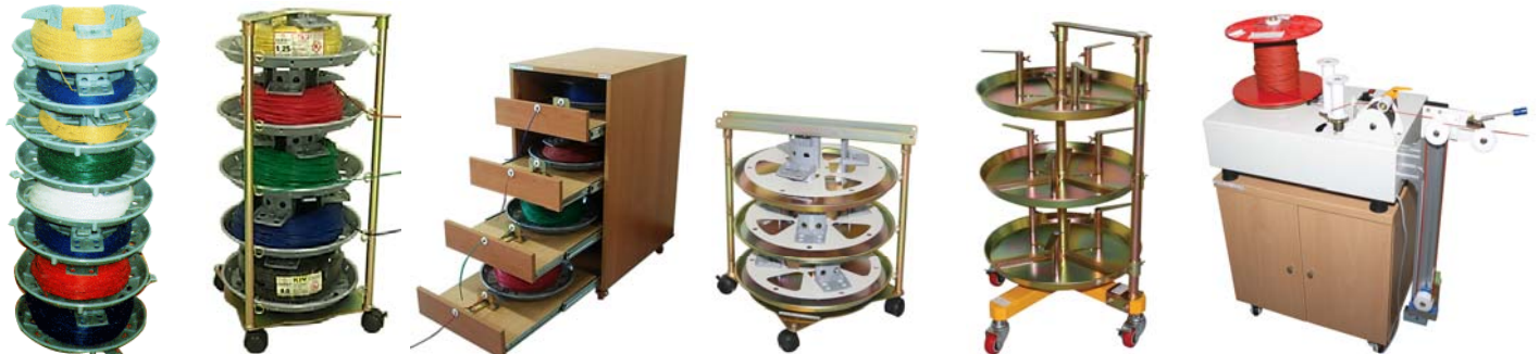
SA Series SC5A-100 SD4A-320 RT3A-420 RM3A-520 AWS-RP

※. 마찰판은 2종류(고무, SUS)로 구성되었으니 조건에 맞추어 사용할 것.